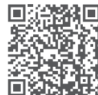
相关资料 (如产品彩页、快速安装指南等)

深圳市吉祥腾达科技有限公司 地址: 深圳市南山区西丽中山园路1001号TCL高新科技园E3栋6~8层 网址: www.tenda.com.cn 技术支持邮箱: tenda@tenda.com.cn 技术支持热线: 400-6622-666 服务时间: 周一至周五 上午9:00-12:00 下午13:30-18:00 (节假日除外) V1.0 保留备用